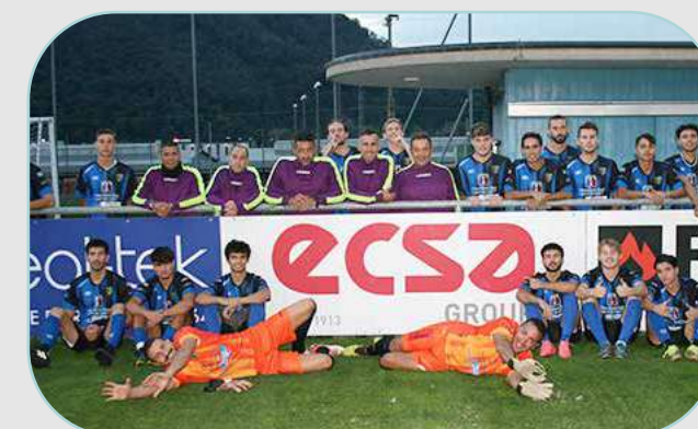
SC BALERNA MASCHILE