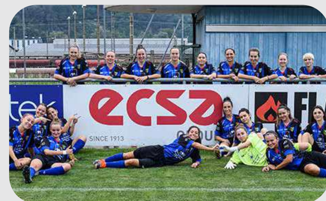
SC BALERNA FEMMINILE