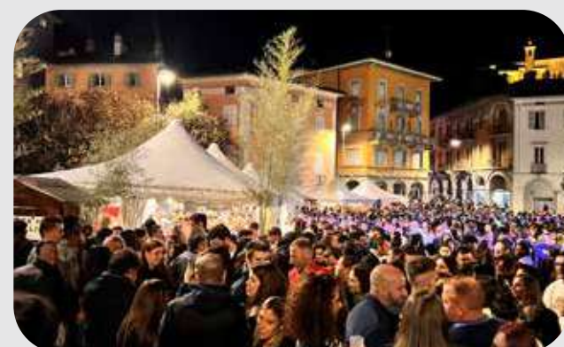
SAGRA DEL BORGO