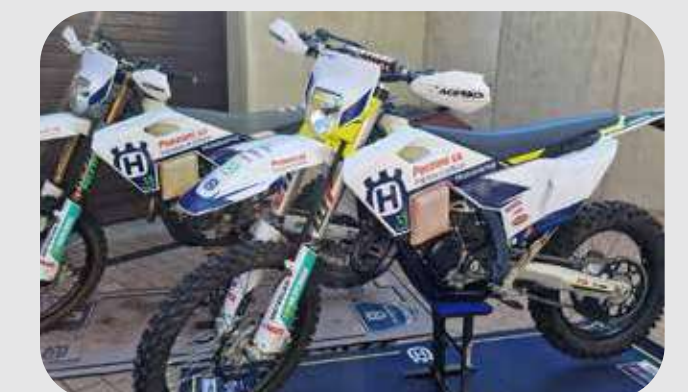
FIM INTERNATIONAL SIX DAYS OF ENDURO (ISDE)